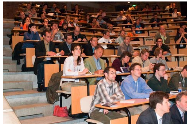
AGILE 2007, Aalborg

Brinkhoff, T.: Increasing the Fitness of OGC-Compliant Web Map Services for the Web 2.0. 10th AGILE International Conference on Geographic Information Science, Aalborg, Denmark, Mai 2007.