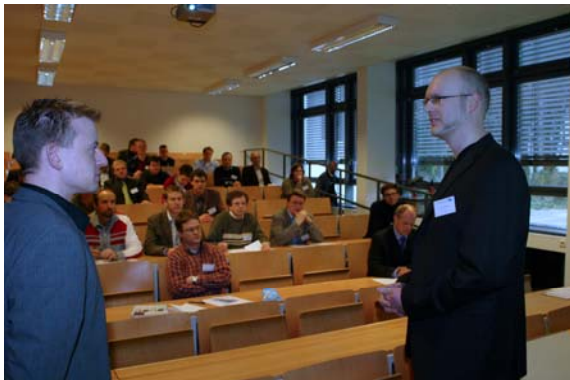
Forum Freie GI-Systeme, Oldenburg, Februar 2007