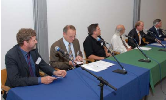
Podiumsdiskussion bei der ZKI-Jahrestagung 2007