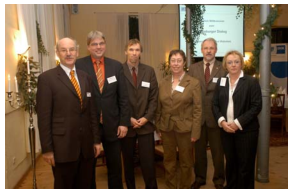
„Oldenburger Dialog“

Brinkhoff, T.: Die effektive Nutzung von OGC-Webdiensten durch mobile GIS-Anwendungen am Beispiel des Katastrophenmanagements. Intergeo-Kongress 2007, Leipzig, September 2007.